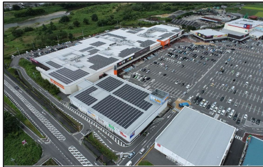
(照片右) 采用 PPA 模式的 “Aeon Town 湖南购物中心” (照片左) 永旺首家 100%再生能源店铺 “永旺藤井寺购物中心”